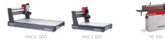
Портальные станки с ЧПУ