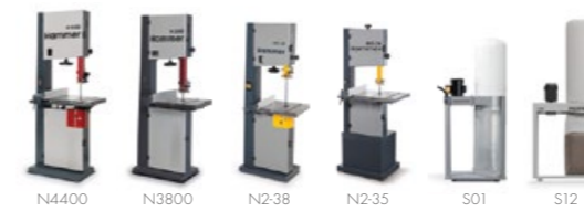
Ленточнопильные станки и аспирационные установки