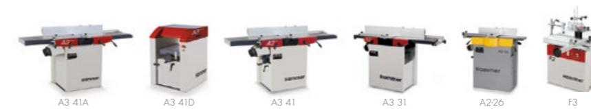
Strugarki & Frezarki