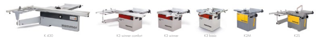
Pilarki tarczowe & formatowe