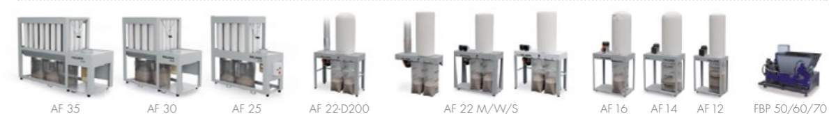
Afzuigsystemen & briketpersen