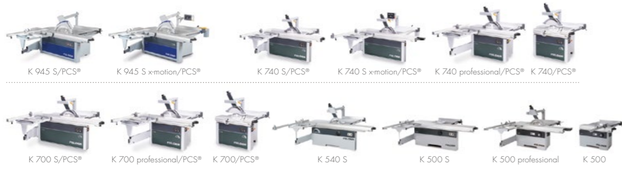
Rund- & formatrundsawe