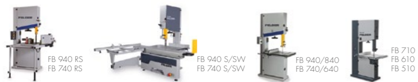
Seghe a nastro