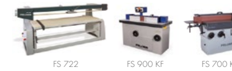
Levigatrici a nastro e per bordi