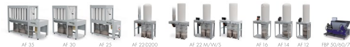
Aspiratori & bricchettatrici