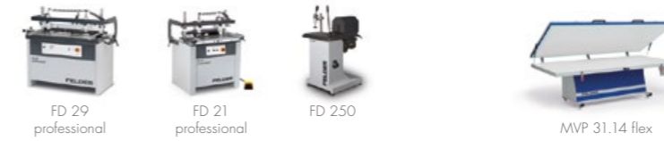
Tassellatrici, cavatrici e mortasatrici