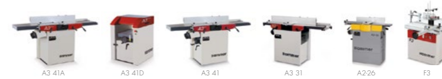
Gyalugépek & formatizáló körfűrész