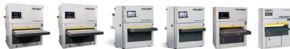
FW 1352 perform FW 1352 classic FW 1102 perform FW 1102 classic FW 950 classic FW 850 classic