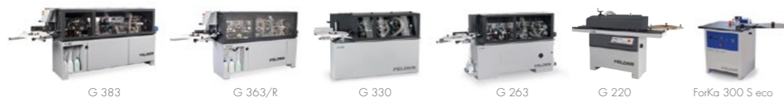
G 383 G 363/R G 330 G 263 G 220 ForKa 300 S eco