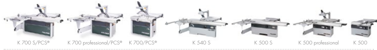
K 700 S/PCS® K 700 professional/PCS® K 700/PCS® K 540 S K 500 S K 500 professional K 500