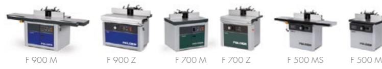
F 900 M F 900 Z F 700 M F 700 Z F 500 MS F 500 M