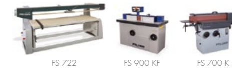
Szalagcsiszoló gépek & élcsiszoló gépek