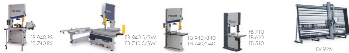
Scies à ruban