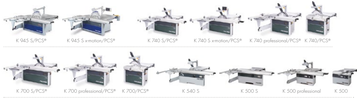
Scies circulaires à format