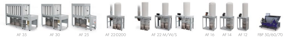
Groupes d'aspiration & presses à briquettes