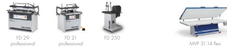
Perceuses multi-broches, perceuses & mortaiseuses