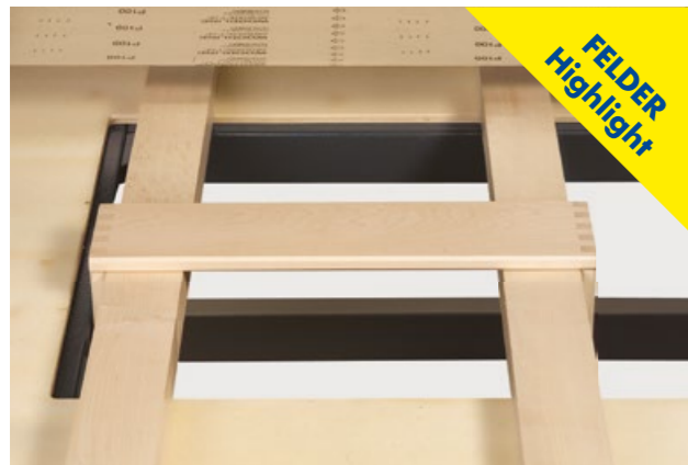
Table de ponçage

Patin de ponçage professionnel avec montage asymétrique, suspension à ressorts, 4 points de fixation réglables, semelle de ponçage à revêtement caoutchouté, largeur 150 mm.