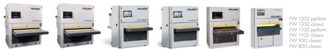
Ponceuses à larges bandes