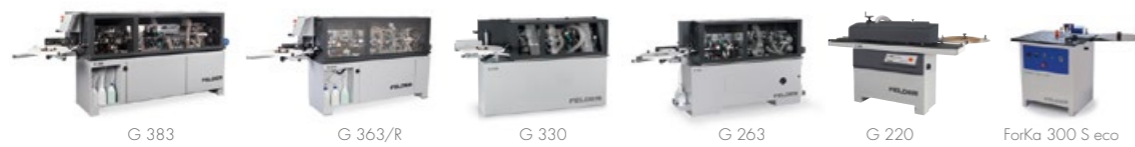
Plaques de chants