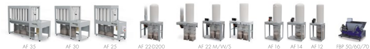
Grupos de aspiración & briquetadoras