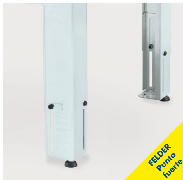
Altura de trabajo ajustable