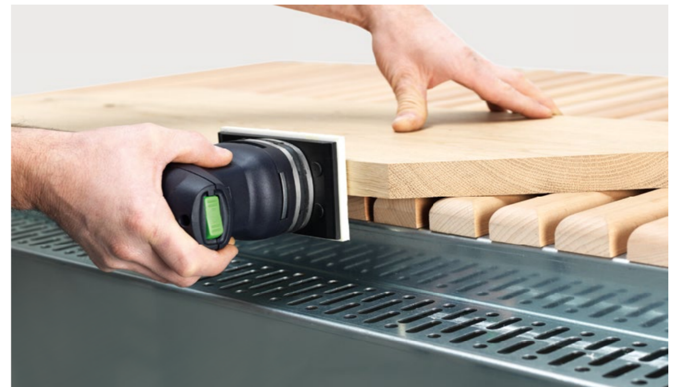
Ejemplo de uso – con canto asentado