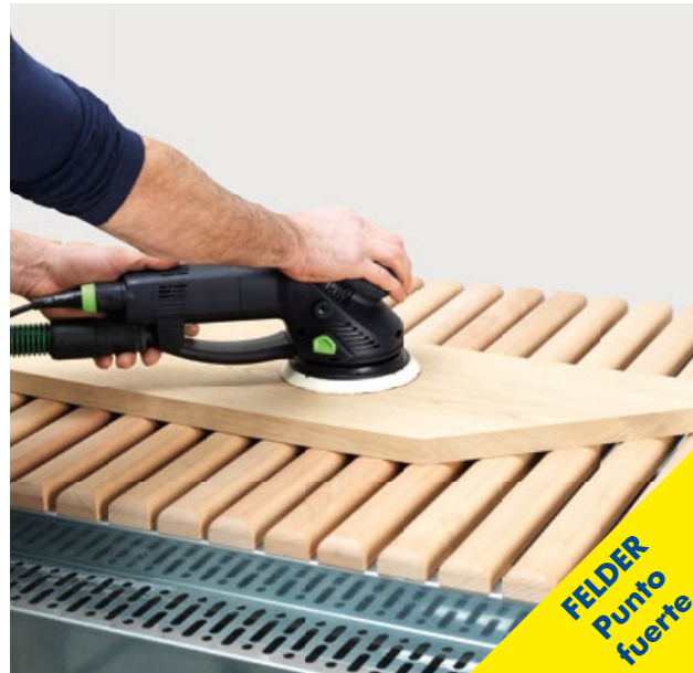
Lugar de trabajo sin polvo, piezas limpias: certificación libre de polvo GS