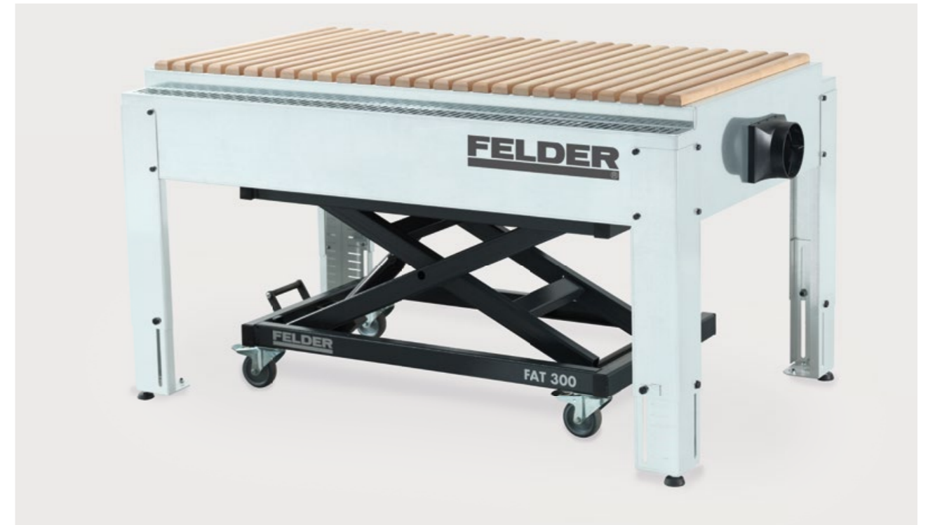
FST 160 con FAT 300 » Ajuste continuo (726 – 1326 mm) » Accesorios móviles