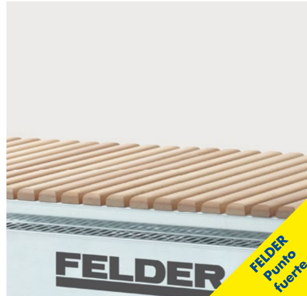
Gran área de contacto con aspiración continua.