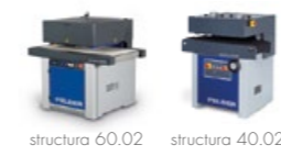
structura 60.02 structura 40.02