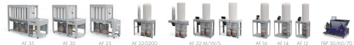
AF 35 AF 30 AF 25 AF 22-D200 AF 22 M/W/S AF 16 AF 14 AF 12 FBP 50/60/70