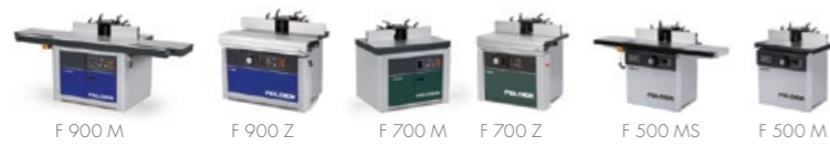
F 900 M F 900 Z F 700 M F 700 Z F 500 MS F 500 M