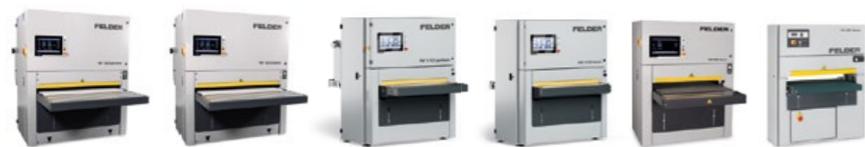
FW 1352 perform FW 1352 classic FW 1102 perform FW 1102 classic FW 950 classic FW 850 classic