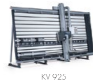
Velkoplošná svislá pila