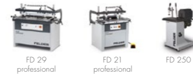
Kolikovačky a dlabačky