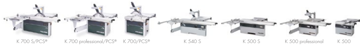
Kotoučové a formátovací pily