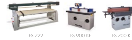
Pásově brusky, hranově brusky