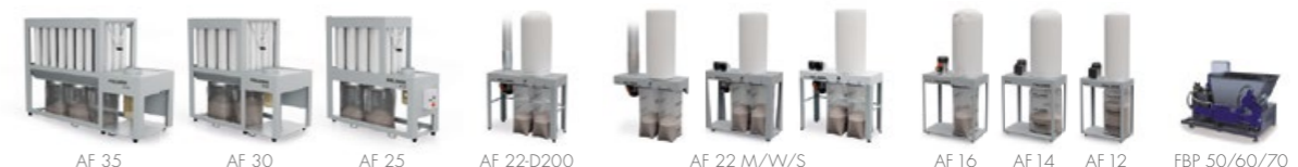
Filtrační jednotky, odsavače a briketovací lisy