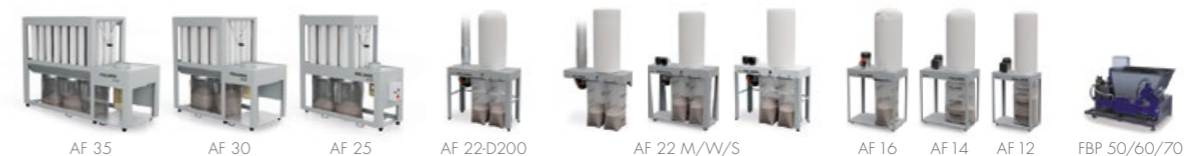
Odsavače a briketovací lisy