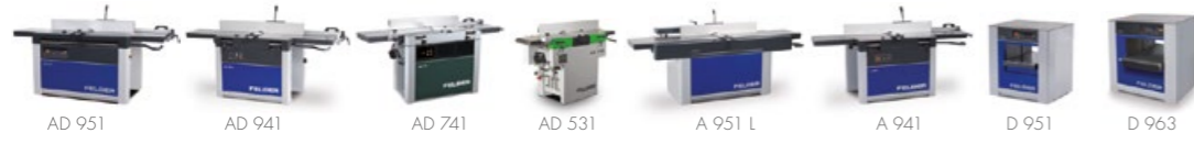
Tloušťková a srovnávací frézky