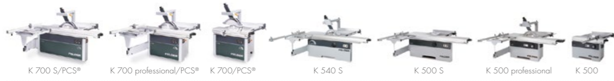
Kotoučové a formátovací pily