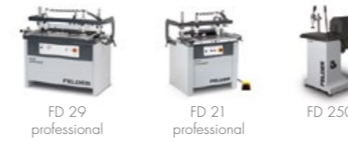
Kolíkovačky a dlabáčky