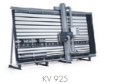
Velkoplošná svislá pila