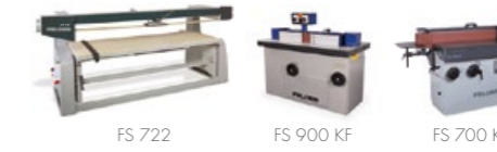
Pásové brusky, hranové brusky