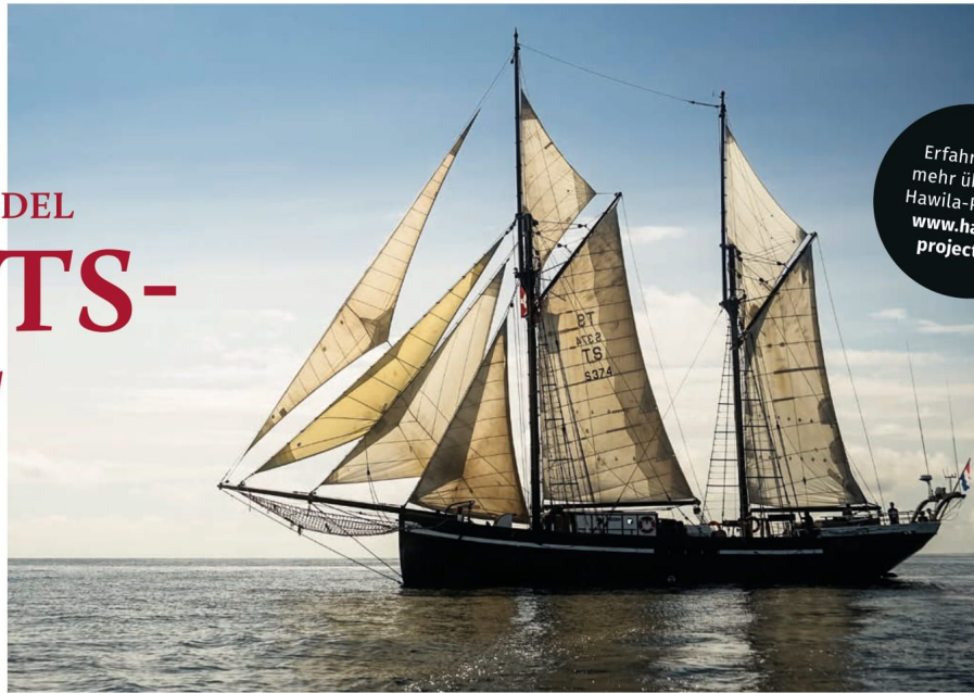
Die Hawila: ein Schiff mit reicher Geschichte und vielversprechender Zukunft.

Das Steuer in Händen der Zukunft entgegen. Ein Motto, das zwei Visionsträger miteinander verbindet: die Hawila – ein Segelschiff, das den Seetransport revolutionieren soll, und die Felder Group – ein führendes Technologieunternehmen im Maschinenbau.