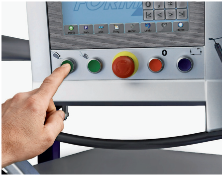
Die Sicherheitsabsenkung erfolgt beschädigungsfrei, auf Knopfdruck ist die Säge wieder einsatzbereit.

TECHNIK Das neue „Preventive Contact System“ PCS von Felder hilft, schwere Unfälle an der Formatkreissäge zu verhindern.